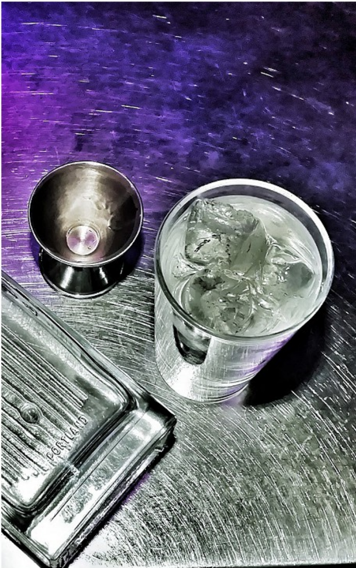
Un bicchiere di Top Gun

Nato nel 2006 come prima collaborazione tra distillatori e baristi della storia americana, prende il nome dal cocktail Aviation e appartiene a una nuova categoria di Dry Gin, in cui viene dato minor risalto al ginepro in favore di un più bilanciato mix di erbe botaniche, in questo caso: ginepro, cardamomo, lavanda, sarsaparilla indiana, buccia d'arancia dolce, semi di coriandolo e anice, messe in sacchi di nylon in infusione per 18 ore in alcol da grano.